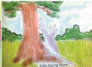
(4) kak may may (2019: 4)

Contoh data (1 s.d. 4) menunjukkan adanya perbedaan persepsi terhadap pembaca sasaran (pengguna). Oleh karena itu, dalam menyediakan bahan bacaannya pun menjadi beragam. Penggunaan bahasa verbal sangat beragam, baik dalam kuantitas maupun tingkat kesulitannya. Contoh data 1 dan 2 lebih menonjol narasi verbal gambar/ilustrasi yang mendukungnya sehingga lebih dekat dengan bentuk cerita bergambar. Berbeda dengan contoh 3 dan 4, penggunaan bahasanya sederhana dan sekadar menerangkan gambar. Permendikbud, Nomor 137, Tahun 2014, tentang Standar Nasional Pendidikan Anak Usia Dini, Tahun 2014 tentang Standar Nasional Pendidikan Anak Usia Dini, Pasal 7, Ayat 5, Butir c, menyatakan bahwa dalam hal keaksaraan pada anak usia dini, cakupannya ialah pemahaman terhadap hubungan bentuk dan bunyi huruf, meniru bentuk huruf, dan memahami kata dalam cerita.