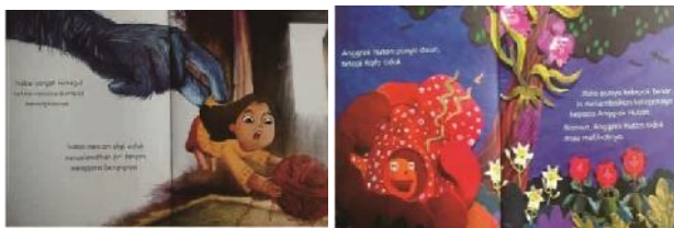
(11) Wikan Satriati (2010: 12) (12) Debby Lukito G. (2019: 4)

Namun demikian, hasil penelitian menunjukkan bahwabahanbacaan yang disediakan untuk kepentingan literasi emergen masih banyak yang terjebak menyuguhkan teks (tulisan) yang belum dapat “dibaca” oleh pembaca sasaran. Gambar/ilustrasi yang disuguhkan banyak yang menjadi pendukung untuk memperjelas teks (narasi) atau cerita yang disampaikan, bukan tulisan sekadar untuk menyatakan gambar, sebagai awal memperkenalkan kepada penggunanya. Potongan bahan bacaan berikut ini menunjukkan bahwa teks menjadi yang utama.