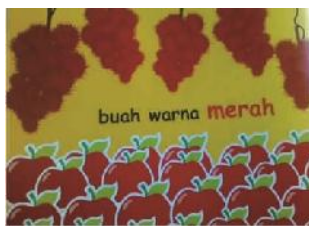
(7) Agus Budi Nugroho (2019: 3)

baca dan menulis. Contoh data cerita nonfiksi ialah sebagai berikut.