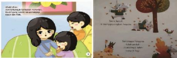
(5) Ilham Nur Ramli (2019: 2)

Semestinya yang menjadi inti cerita ialah gambarnya, sedangkan teksnya (verbal tulisannya) merupakan pernyataan tentang gambar. Teks berfungsi menyatakan gambar/ilustrasi sebagai pengenalan tulisan kepada pengguna. Ketidaksesuaian isi bacaan dan pembaca sasaran dalam literasi emergen dapat dilihat dalam contoh data sebagai berikut.