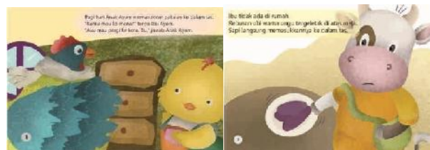
(13) Heru Kumiawan (2019: 1) (14) Cesilia Prawening (2019: 3)

Narasi menjadi kekuatan dalam menyuguhkan bahan bacaan, bukan untuk memperkenalkan tulisan (bacaan). Hal itu dapat juga dilihat contoh berikut ini.