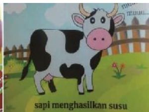
(8) Agustina DR (2019: 6)

Teks pada bahan bacaan itu tidak banyak “berbicara”, tetapi hanya sekadar mendukung dan memberikan pengenalan alfabetik atau lambang-lambang bunyi kepada pengguna (pembaca sasaran). Yang lebih banyak berperan ialah gambar itu sendiri karena pengguna belum dapat mengenal bahasa verbal tulisan.