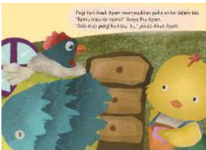
(1)Heru Kurniawa (2019: 1)