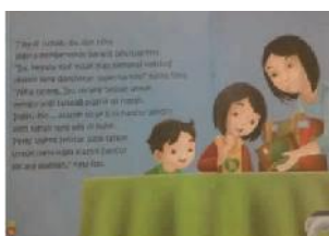
(9) Valerina Daniel (2010: 16)

Bacaan literasi emergen lain yang juga banyak ialah terkait dengan olah rasa dan karsa. Bacaan ini isinya lebih mengedepankan pesan (ajaran) yang ingin disampaikan kepada penggunanya. Oleh karena itu, bahan bacaannya mayoritas berbentuk cerita bergambar. Kekuatan cerita terletak pada teks (narasi) dan gambar sebagai pendukungnya. Misalnya, cerita berjudul Tas Warna-Warni karya Valerina (2010) yang berisi pesan agar menyayangi bumi (peduli lingkungan) dengan cara mengurangi sampah plastik. Selain pesan itu, cerita itu juga mengajarkan untuk mendaur ulang sampah plastik menjadi kreasi tas yang menarik. Cerita yang lain, misalnya berjudul Subhanallah, Manusia Bisa Membuat Kertas karya Nia Kurniawati (2011) yang menceritakan proses terjadinya kertas. Contoh potongan ceritanya sebagaimana berikut berikut ini.