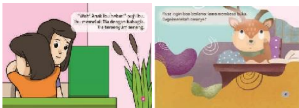
(15) Agustina W.S. (2019: 12) (16) Umi Khomsiyatun (2019: 4)

Pada setiap halaman bacaan terlihat dominasi gambar/ilustrasi. Akan tetapi, sesungguhnya hanya karena gambar/ilustrasi yang diperbesar sehingga teksnya menjadi "tertutup", apalagi dengan jenis huruf yang relatif kecil untuk ukuran "pembaca" dalam literasi emergen, sebagaimana contoh berikut ini.