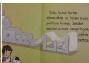
(10) Nia Kurniawati (2011: 17)

Selain kedua cerita itu mengajak penggunaannya untuk bersyukur kepada Tuhan, isi cerita juga mengajarkan tentang cara membuat tas plastik dengan memanfaatkan limbah; memberikan pengetahuan proses terjadinya kertas.