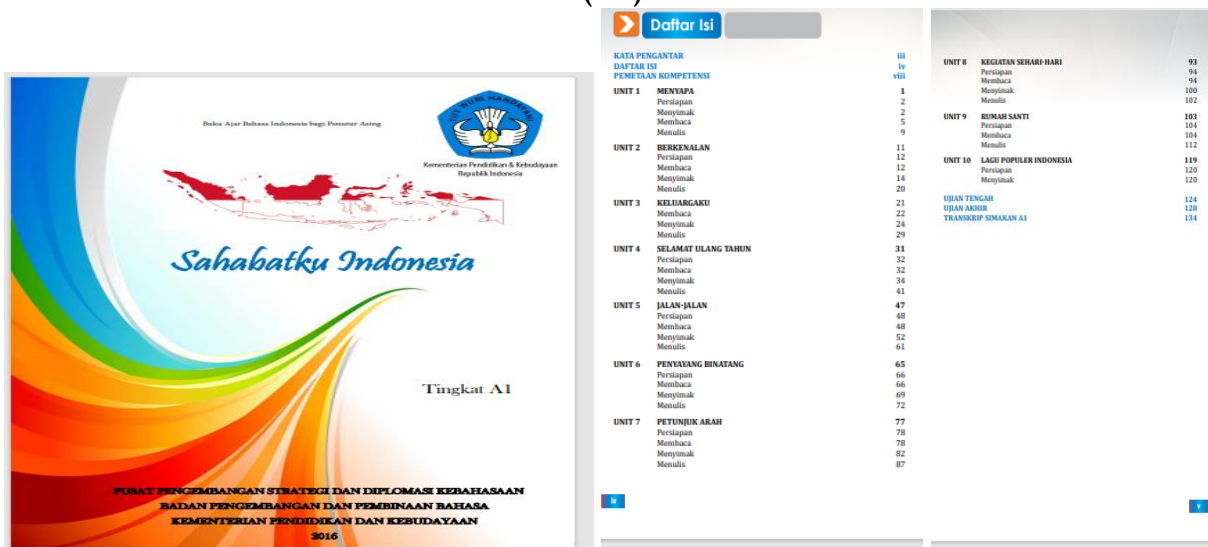
Gambar 2 Tema-tema dalam BIPA 1 (A1) dalam buku Sahabatku Indonesia

Buku BIPA 2 Sahabatku Indonesia untuk Anak Sekolah ini juga ada 10 tema. Ada satu tema pada BIPA 1 diulang lagi pada BIPA 2, yakni profesi atau pekerjaan. Kesepuluh tema tersebut dapat dilihat dari Gambar 3 berikut.