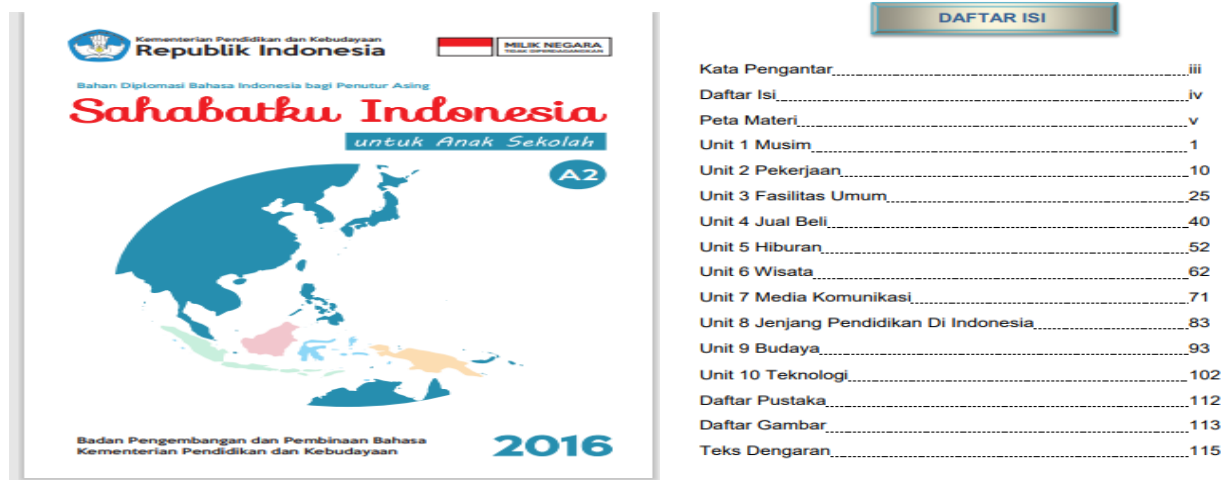
Gambar 3 Tema-tema dalam BIPA 2 (A2) dalam buku Sahabatku Indonesia

Selanjutnya, teknik pengumpulan data untuk tanggapan pemelajar diperoleh dengan cara menanyakan langsung kepada pemelajar setelah materi menyimak diberikan, baik saat online di Zoom maupun tanya jawab melalui WA. Materi menyimak yang dinilai pemelajar tidak semuanya, namun hanya beberapa saja. Materi menyimak BIPA 1 yang dibandingkan penilaian pemelajar adalah tema audio “Rumah.” Penilaian dilakukan saat pembelajaran BIPA 1, yakni pada jam ke-87 – ke-90 dari 100 jam pembelajaran BIPA 1 secara online di IPB pada bulan Oktober 2021. Selanjutnya, materi BIPA 2 yang dinilai pemelajar adalah Tema 2, 3, dan 4 pada bulan November 2021.